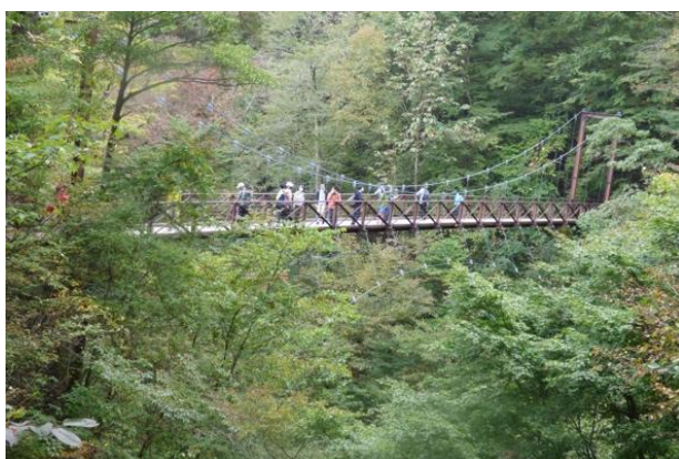
【図2】 森林における実験風景（檜原村：大滝の路）